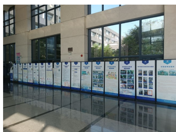
实验室安全教育宣传活动